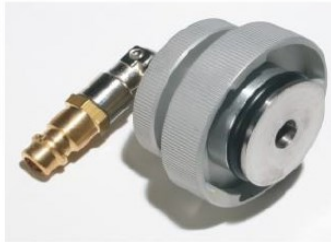
Adapter: BS/BS W-Serie