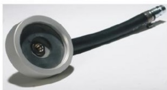
Adapter: E 20 W