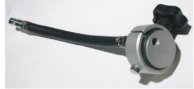
Adapter: 3 O-Serie