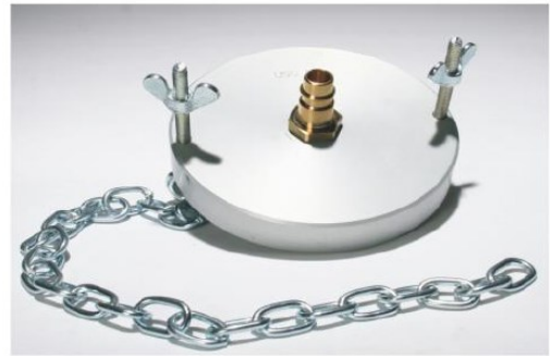
Adapter: U90/U100 K